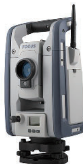
Spectra Geospatial Focus 50